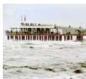
Il Lido di Camaiore

DI VIETATO di balneazione in due punti della spiaggia nei Comuni di Camaiore e di Pietrasanta. Non c'è pace per la Versilia quest'anno. I due Comuni hanno preso atto dell'informativa recapitata loro dall'Arpat e relativa ai risultati sfavorevoli delle analisi su campioni di acqua prelevati il 1° settembre scorso. Hanno così firmato ordinanze con il divieto di balneazione temporanea sulle aree «Foce Fossa dell'Abate», «Piazza Matteotti», «Arlecchino» nel comune di Camaiore e, «Foce Fosso Motrone» circa cento metri a nord, «Jamaica Pub-Tonfano», «Foce Fosso Fiumetto» (circa cento metri a nord) nel comune di Pietrasanta.