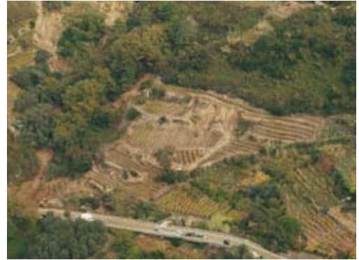
Fig. 8. (A sinistra) Evento franoso verificatosi a carico di un vigneto terrazzato adiacente ad un'area forestale. (Left) A landslide that impacted a terraced vineyard adjoining a wooded area.