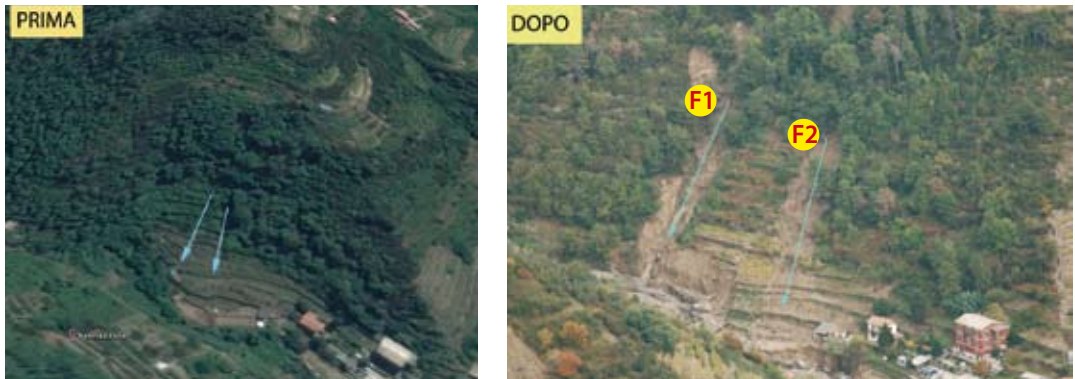
Fig. 5. (In alto a sinistra) La foto aerea del 2006; (a destra) La fotografia dello stesso luogo scattata il 2 novembre 2011. Le due frane (f1 e f2) sono avvenute su terrazzamenti abbandonati di recente. (Above, left) An aerial photograph of the year 2006; (right) The corresponding picture taken on 2 November 2011. The landslides (f1 and f2) occurred on recently abandoned terraces.

ne visiva del materiale e classificato. Successivamente, per ogni evento di dissesto è stata costruita una legenda di riclassificazione in base agli usi del suolo su cui l'evento si è verificato, distinguendo corpi di frana e nicchie di distacco