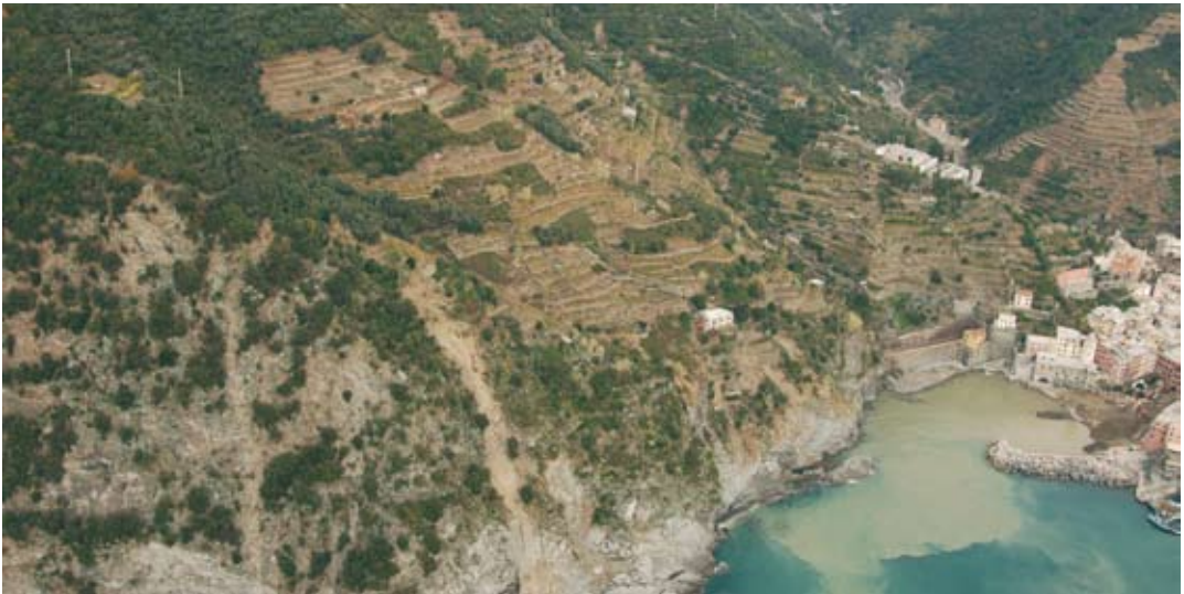
Fig. 3. Abitato di Vernazza. La fotografia evidenzia una frana avvenuta su terrazzi abbandonati e coperti dalla vegetazione forestale. The settlement of Vernazza. The photograph highlights the landslides occurred on abandoned terraces now covered by woods.

Il materiale di analisi utilizzato riguarda un filmato realizzato da telecamera mobile e circa 500 scatti fotografici effettuati in data 2 Novembre 2011 (Fig. 3), da un elicottero in volo nell’area di Vernazza – Monterosso (SP) 6 .