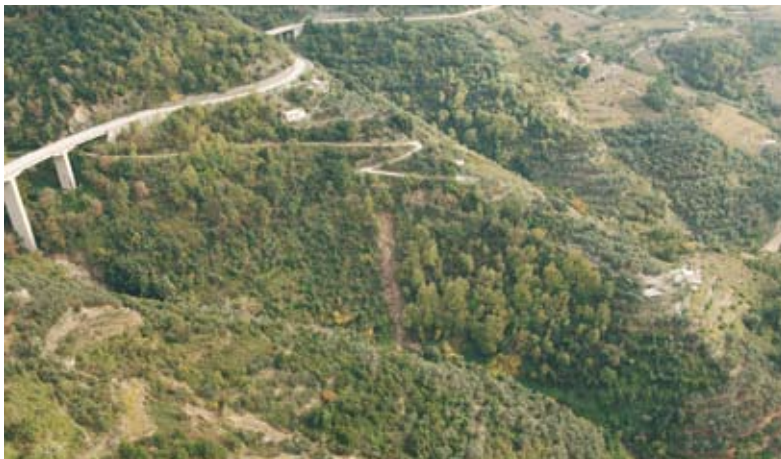
Fig. 7. Esempio di frana verificatasi in corrispondenza di un'area in cui è stata asportata la vegetazione arborea ed è stata realizzata una nuova viabilità secondaria. Example of a landslide in an area where the tree cover was removed and a new secondary road was built.

Infine, in 5 casi su 88 (5,68%) si rilevano eventi franosi in corrispondenza di colture in atto: è interessante notare come in genere l'evento si verifichi al margine delle colture al confine con aree forestali (Fig. 8). In un caso il fenomeno si realizza in corrispondenza di un'area in cui la disposizione dei filari di vigna si è inusualmente (per la zona) realizzata a girapoggio in alternanza al rittochino (Fig. 9).