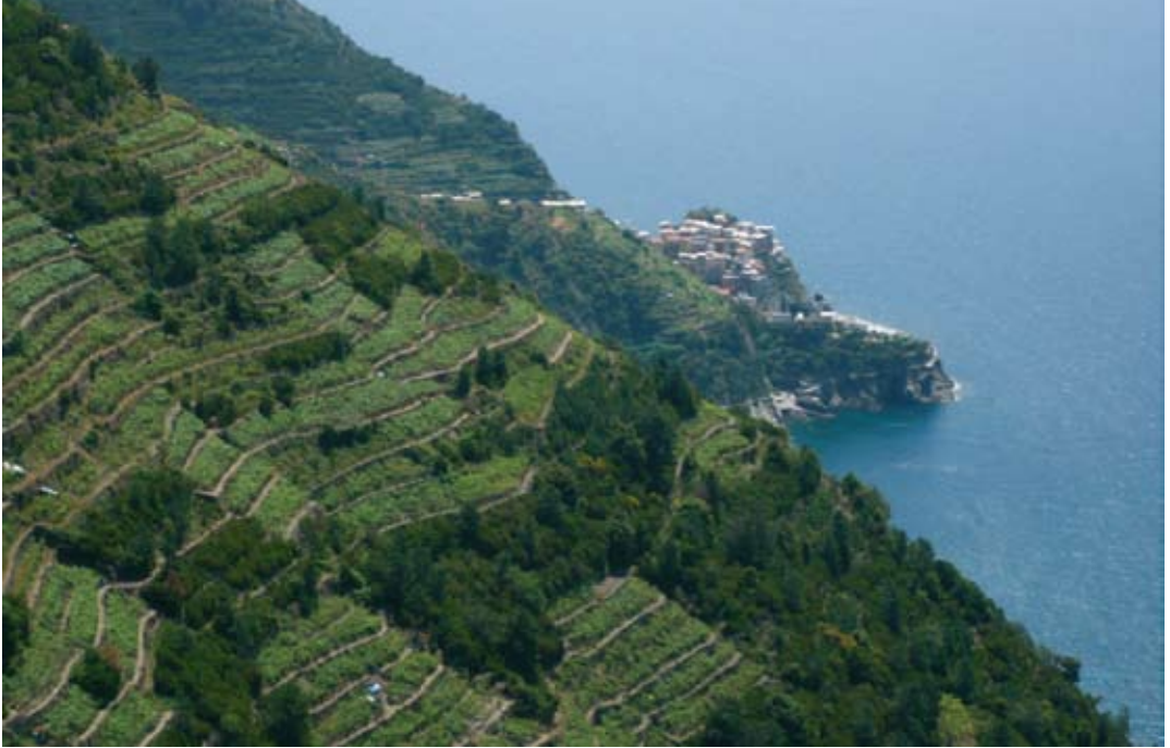
Fig.1. Terrazzamenti delle Cinque Terre, oltre al grande valore storico ed estetico, svolgono un fondamentale ruolo produttivo e di riduzione del rischio idrogeologico. In Cinque Terre, terracing, besides having great historical and aesthetic value, plays a fundamental role in agricultural production and in the reduction of hydrogeological risk.

l'area è legata non solo alla presenza di una viticoltura produttiva, ma anche al fatto di essere inserita in un Parco Nazionale che è anche paesaggio UNESCO inserito nel patrimonio mondiale dell'umanità. Sembrava quindi particolarmente significativo valutare i fenomeni avvenuti, non solo per contribuire alle iniziative volte a prevenire il ripetersi di tali eventi, ma anche per il significato questa zona a livello mondiale, in particolare per la storia dei terrazzamenti.