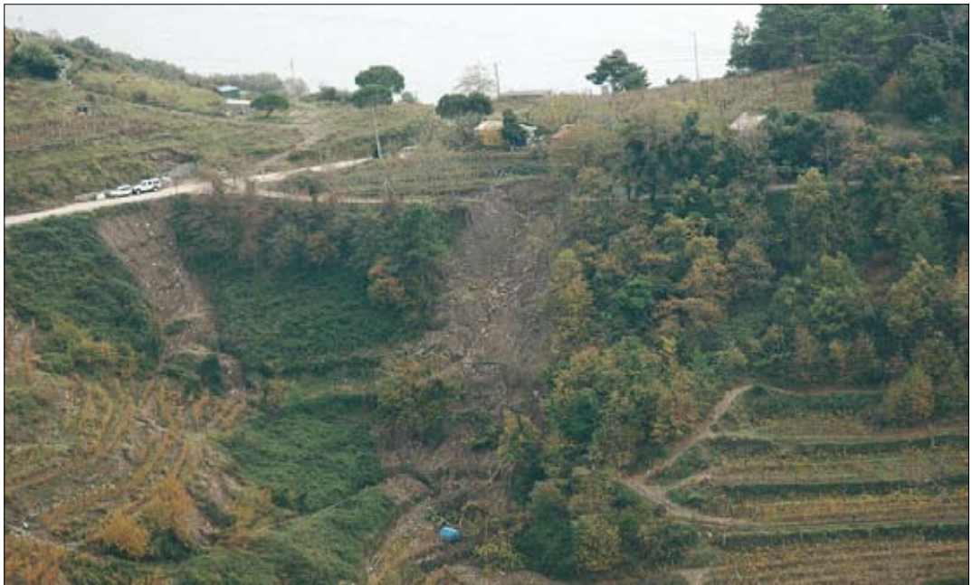
Fig. 10. Evento franoso verificatosi a seguito del cedimento della scarpata a valle della strada. A landslide caused by the collapse of a bank downhill from a road.