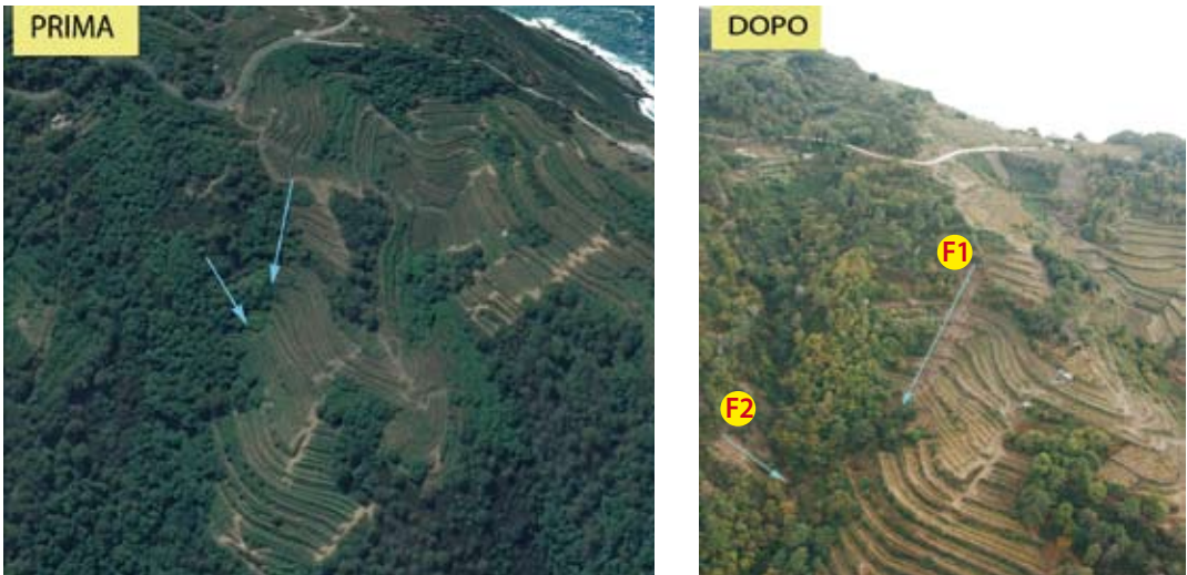
Fig. 6. (In alto a sinistra) La foto aerea del 2006; (a destra) la fotografia dello stesso luogo scattata il 2 novembre 2011. La frana è avvenuta su terrazzamenti coperti dal bosco. (Above, left) An aerial photograph of the year 2006; (right) the corresponding picture taken on 2 November 2011. The landslides occurred on abandoned terraces covered with woods-