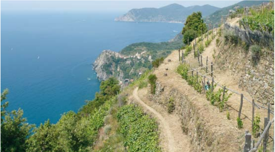
Fig. 2. I terrazzamenti modellano le pendici delle Cinque Terre, preservando molte pratiche tradizionali legate non solo ai materiali costruttivi, ma anche alle tecniche di allevamento della vite. Terracing molds the slopes of Cinque Terre, preserving many traditional practices not only as regards building materials, but also grape-growing techniques.

Dagli anni '70 in poi alle Cinque Terre si è verificato un crollo nell'agricoltura e nella pesca pari a più del 70%. I borghi di Vernazza e Riomaggiore sono quelli in cui il ridimensionamento della viticoltura è stato più rilevante; ad esempio tra il 1982 e il 1990 a Riomaggiore si è registrata una perdita di ben 52 ha e a Vernazza di 24 ha. (Storti, op. cit. ). Tutto questo decremento della superficie a vite può essere considerato una costante degli ultimi trent'anni; lo spopolamento delle campagne ha determinato una costante diminuzione della necessaria manutenzione dei terrazzamenti. La viticoltura a terrazze del territorio delle Cinque Terre rappresenta un patrimonio economico, storico e culturale, un paesaggio modellato, con fatica e sofferenze, dall'uomo per garantirsi la sopravvivenza, ma reso vulnerabile se viene messa in discussione la presenza antropica 5 .