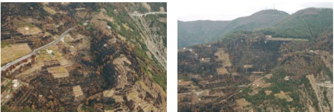
Fig. 11. (A sinistra e a destra) Pinete di pino marittimo sviluppatesi su terrazzi abbandonati percorsi dal fuoco; il fuoco ha riportato alla luce i terrazzamenti sotto la copertura forestale ancora in perfetto stato di conservazione. (Left and right) Maritime pinewoods on abandoned terraces ravaged by a fire. The fire has brought back to light the terracing underlying the forest cover but still in good conditions.