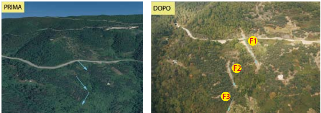
Fig. 4. (In alto a sinistra) Una foto aerea dell'anno 2006. (In alto a destra) La fotografia dello stesso luogo scattata il 2 novembre 2011. Le frane sono avvenute su terrazzamenti abbandonati e coperti dal bosco: f1: bosco misto; f2: terrazzamenti olivati abbandonati; f3: arbusteto/macchia. (Above, left) An aerial photograph of the year 2006. (Right) The corresponding picture taken on 2 November 2011. The landslide occurred on mixed woods (f1), abandoned olive terraces (f2) and shrubland (f3).